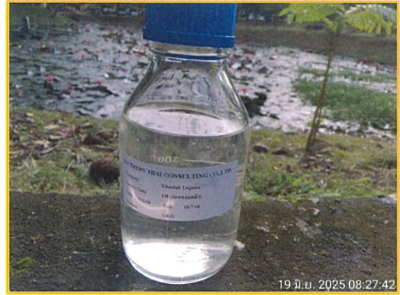
ภาพที่ 1-2 แสดงการเก็บตัวอย่างคุณภาพน้ำผ่านการบำบัด (ก่อนลงบ่อบัว)