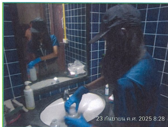
ภาพที่ 3 แสดงการเก็บตัวอย่างคุณภาพน้ำใช้