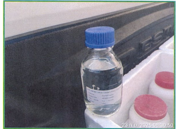
ภาพที่ 1-2 แสดงการเก็บตัวอย่างคุณภาพน้ำผ่านการบำบัด (ก่อนลงบ่อบัว)