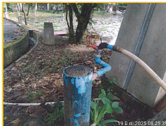
ภาพที่ 3 แสดงการเก็บตัวอย่างคุณภาพน้ำใช้