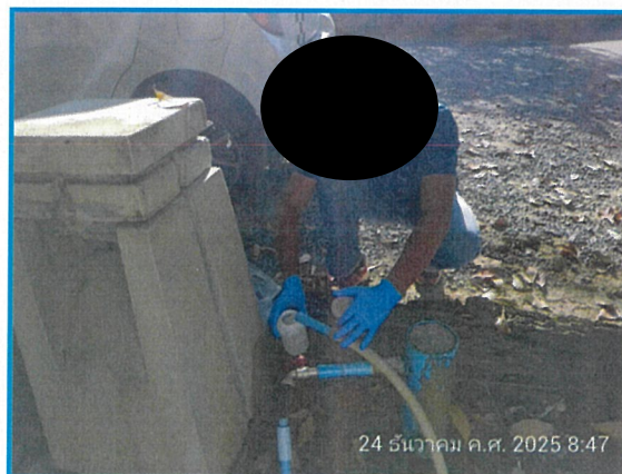
ภาพที่ 3 แสดงการเก็บตัวอย่างคุณภาพน้ำใช้